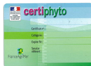
Figure 2 la face verso du Certiphyto

Plusieurs certificats ont été définis, selon l'activité du professionnel. Ils peuvent être obtenus par la formation et/ou par un test de connaissances.